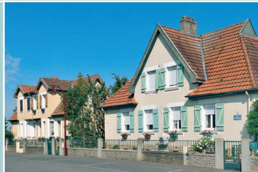
YUTZ, la cité des ateliers

Progressivement de nouvelles Zones d'Activité voient le jour : Zone du Kickelsberg à Basse-Ham, Zone de Metzange-Buchel à Thionville, Actypôle à Yutz, Zone de l'Émaillerie à Manom... celles-ci étant aujourd'hui d'intérêt communautaire.